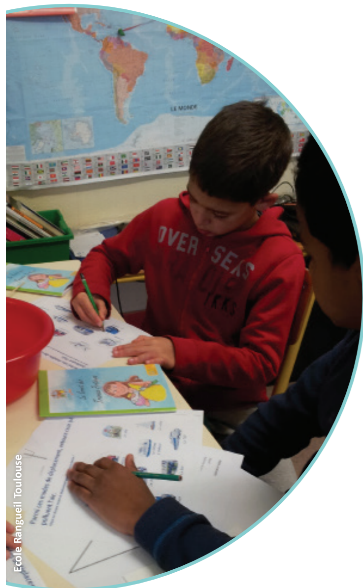
Ecole Rangueil Toulouse

Rapidement, le choix s'est porté sur l'adaptation du support de sensibilisation « L'Air et Moi », créé par Air PACA, association agréée de surveillance à la qualité de l'air en région PACA qui travaillait depuis cinq ans sur sa réalisation.