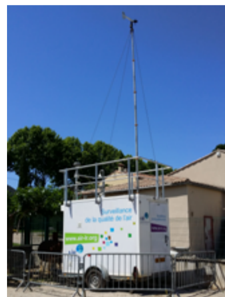
■ Laboratoire mobile