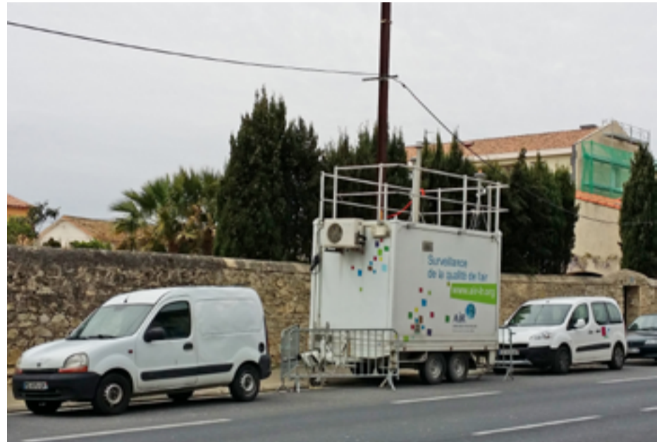
■ Laboratoire mobile RD613